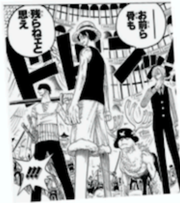
Echiro Oda Der Macher von "One Piece" Ich liebe es wie er seine Charaktere in "Coole Pose" stellt.