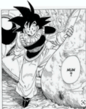
Akira Toriyama Der Schöpfer von Dragon Ball Bei ihm hab ich mir z.B. abgeschaut, wie er Falten in Stoffen zeichnet.